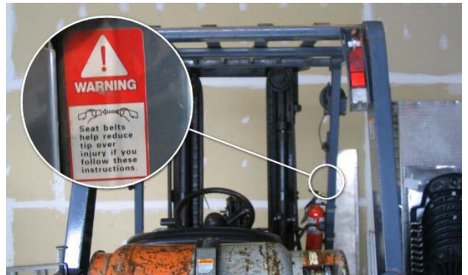
ตามมาตรฐานของอเมริกาเหนือ ฟอร์กลิฟต์ทุกคันจะต้องมีเข็มขัดนิรภัยสำหรับคนขับอย่างน้อย 1 เส้น หากไม่มีติดรถจะติดตั้งเพิ่มเข้าไป