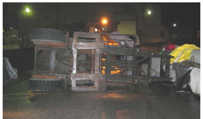
การพลิกคว่ำ (ทั้งการพลิกคว่ำไปด้านหน้าหรือการพลิกคว่ำไปด้านหลัง) เป็นอุบัติเหตุร้ายแรงที่เกิดจากการใช้ฟอร์กลิฟต์คิดเป็นอัตราเฉลี่ยถึง 25% ของอุบัติเหตุที่เกิดขึ้นทั้งหมด ดังนั้นควรหลีกเลี่ยงการขับเคลื่อนเข้าไปในพื้นที่ที่เป็นอันตรายและจะต้องรัดเข็มขัดนิรภัยทุกครั้ง

❖ ทำตามคำแนะนำวิธีปฏิบัติตัวเมื่อฟอร์กลิฟต์พลิกคว่ำตามลำดับคือ ห้ามกระโดด ยึดพวงมาลัยไว้ให้แน่น กางขาออกแล้วใช้เท้ายันพื้น และเอนตัวในทิศทางที่ผืนกับตัวรถที่กำลังจะพลิกคว่ำ