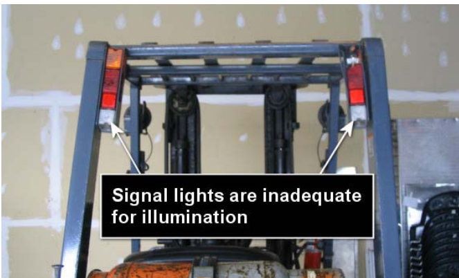
แนวใจารรถฟอร์กลิฟต์มีไฟสัญญาณ (การเบรก การเลี้ยวและการถอยหลัง) อย่างครบถ้วนและให้แสงสว่างที่เห็นได้อย่างชัดเจน