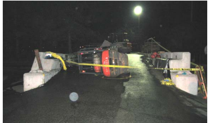
แสงสว่างในพื้นที่ทำงาน จะต้องเพียงพอเพียงตามข้อบังคับของมาตรฐานหรือกฎหมายที่ใช้อ้างอิง